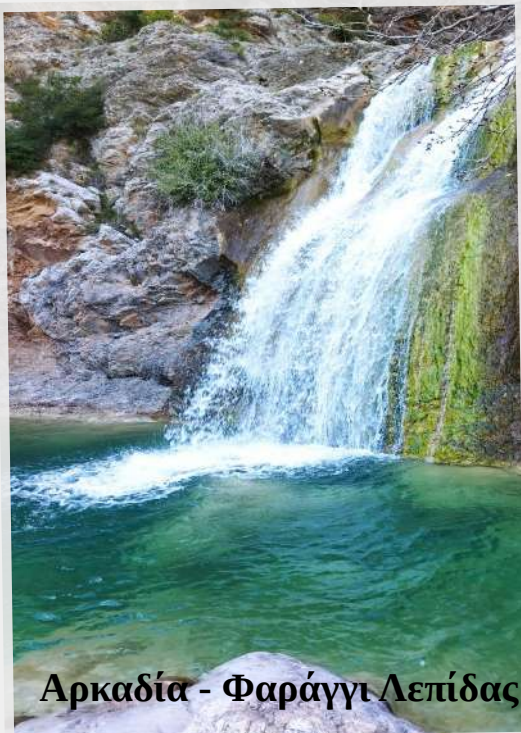
Αρκαδία - Φαράγγι Λεπίδας

Μετά τη δύσκολη κατάβαση... η ώρα της χαλάρωσης στην παραλία