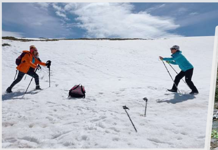
Βέρμιο... Παιχνίδια στο χιόνι