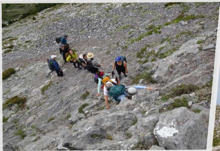
Ανεβαίνοντας στη Δίρφου