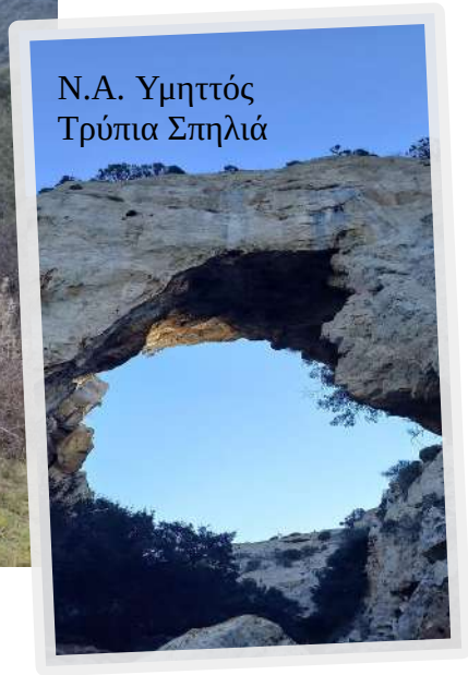
Ν.Α. Υμητός Τρύπια Σπηλιά