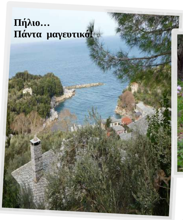
Πήλιο... Πάντα μαγευτικό!