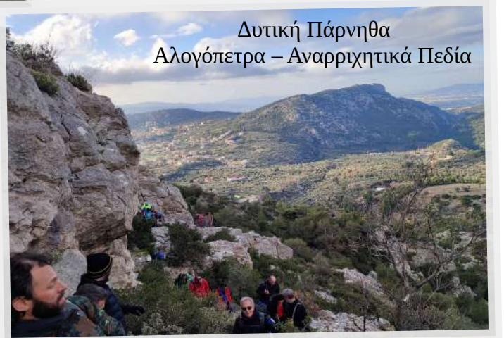
Δυτική Πάρνηθα Αλογόπετρα – Αναρριχητικά Πεδία