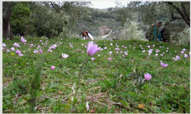
Φωτογραφίζοντας τις ανεμώνες...