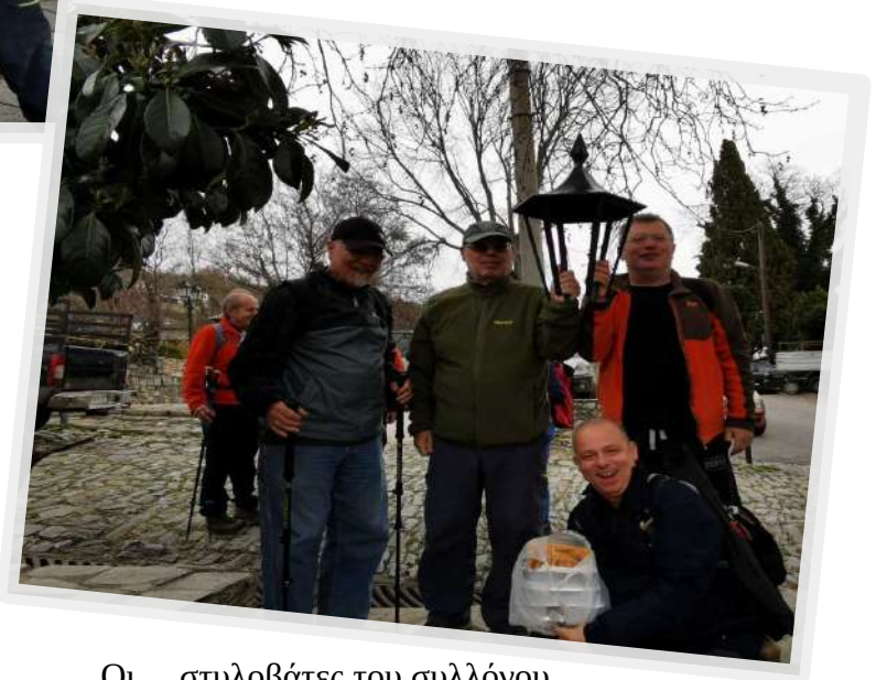
Οι... στυλοβάτες του συλλόγου