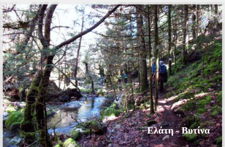
Ελάτη - Βοτίνη