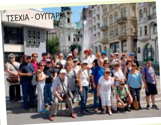
ΤΣΕΧΙΑ - ΟΥΓΓΑΡΙΑ