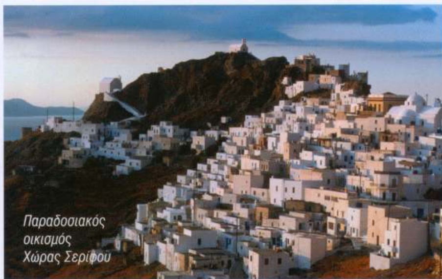
Παραδοσιακός οικισμός Χώρας Σερίφου

Τη Κυριακή , μετά το πρωινό μας, θα αρχίσουμε τη ξενάγησή μας, από τα ερείπια του Βενετσιάνικου Κάστρου, το Δημαρχείο, το Μοναστήρι