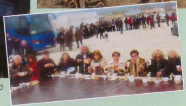
Κοζάνη - Βελβεντό