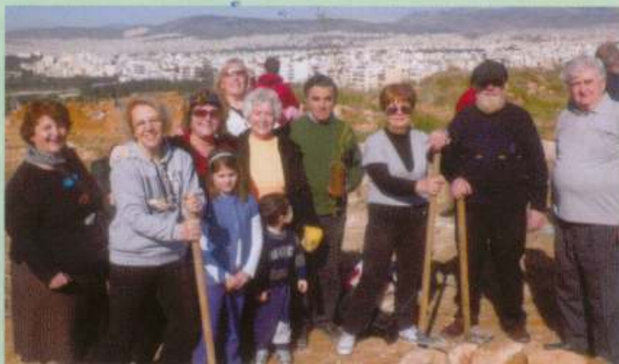
Δενδροφύτευση, 12/3/11 στο Βέικο