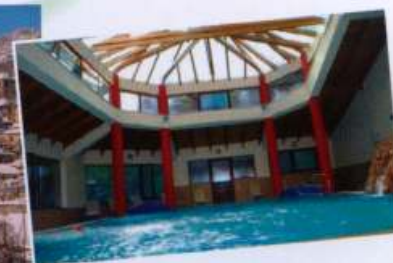
Οι Ιαματικές πηγές του Σμόκοβου