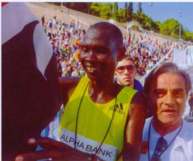
ο Κενυάτης Ρέιμοντ Μπετ 1ος νικητής του 28ου.