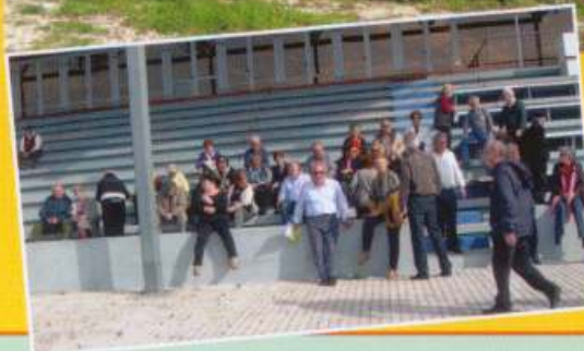
Από την επίσκεψη των μελών της Ο.Ε.Ε.Σ.Ε στον Μαραθώνα και το Κωπηλατοδρόμιο.