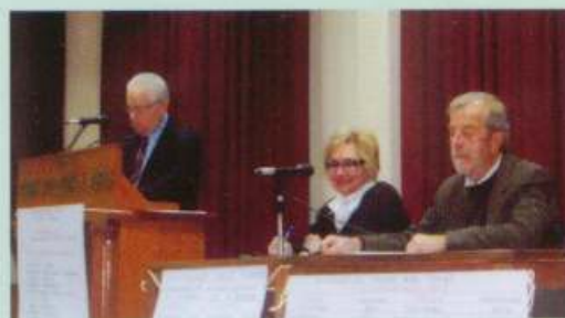
Γενική συνέλευση 15/3/2010