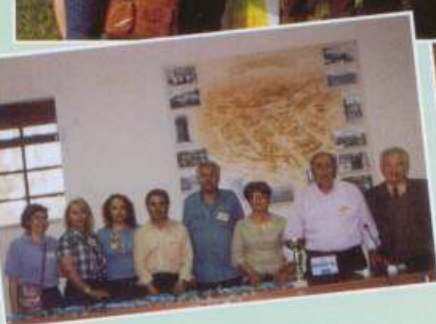
Κυνήγι Θησαυρού 24/4/2010