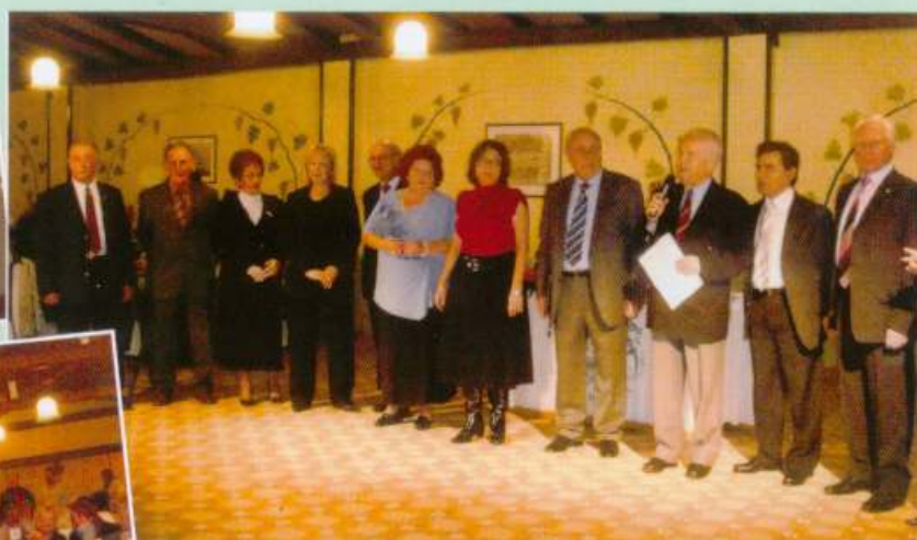
Κοπή Πίτας 17/1/2010