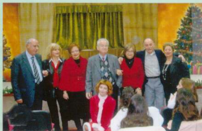
Χριστουγεννιάτικη παιδική γιορτή