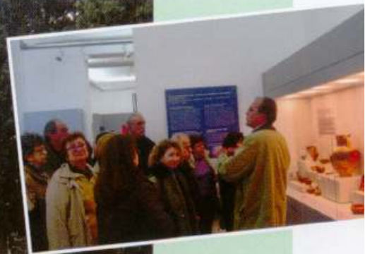
Δαύλεια - Χαιρωνία