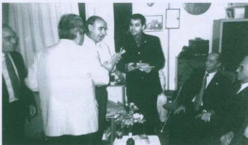
Από την επίσκεψη στα γραφεία του Ομίλου μας των Δημάρχων Αϊόνας Τουρκίας και Νέας Ιωνίας με την ευκαιρία της αδελφοποίησης των δύο πόλεων.

Σε αυτόν τον αγώνα, μπορούν να λάβουν μέρος όσοι θέλουν, ανεξαρτήτου ηλικίας και φύλου.