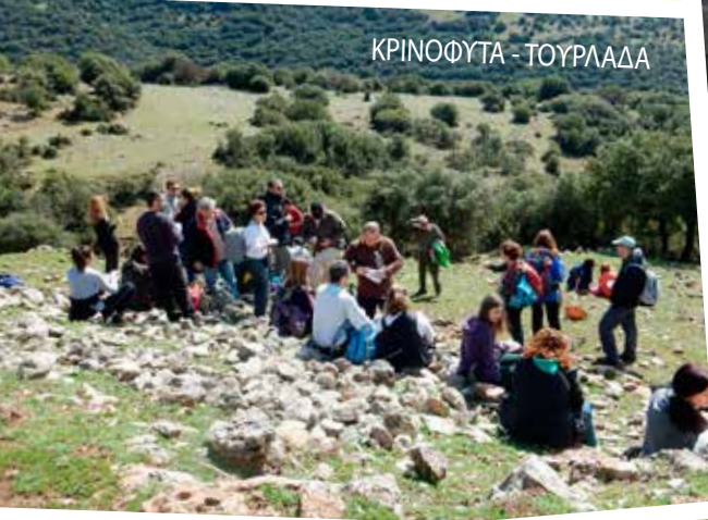
ΚΡΙΝΟΦΥΤΑ - ΤΟΥΡΛΑΔΑ