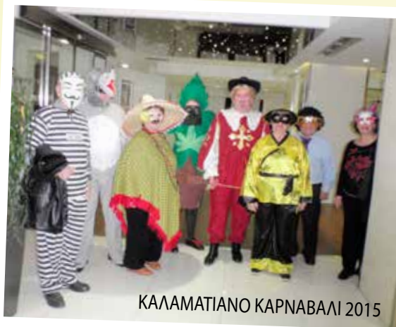
ΚΑΛΑΜΑΤΙΑΝΟ ΚΑΡΝΑΒΑΛΙ 2015