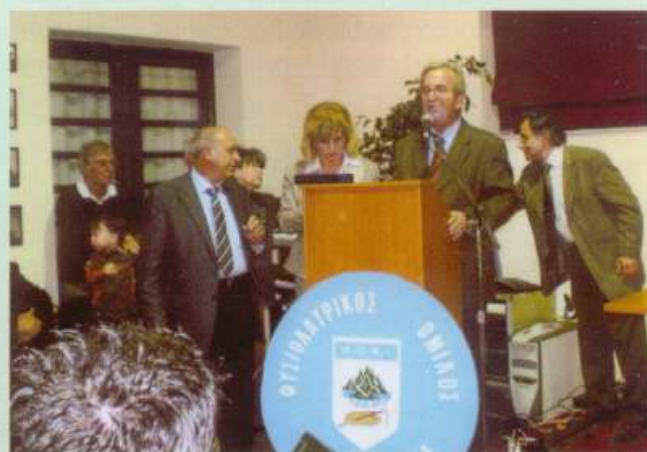
45 χρόνια ΦΟΝΙ, 5/12/07