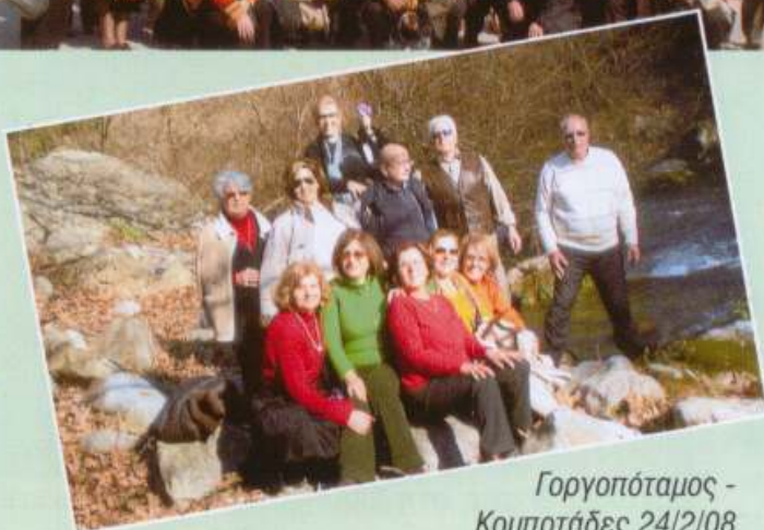
Γοργοπόταμος - Κομποτάδες 24/2/08