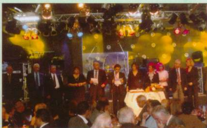
Κοπή πίτας, 13/1/08, κέντρο "κέντρο "ΟΥΡΑΝΟΣ"