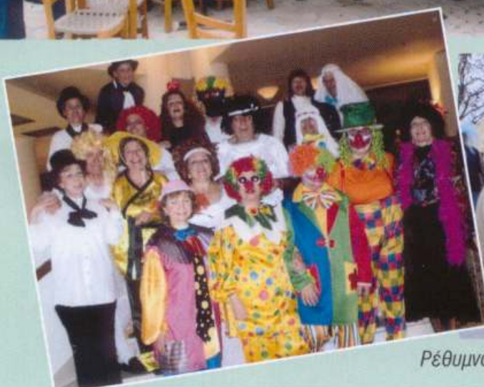
Ρέθυμνο - Καρναβάλι, 9/3/08