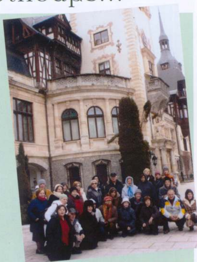
Ρουμανία - Πέλλες, 22-27/12/07