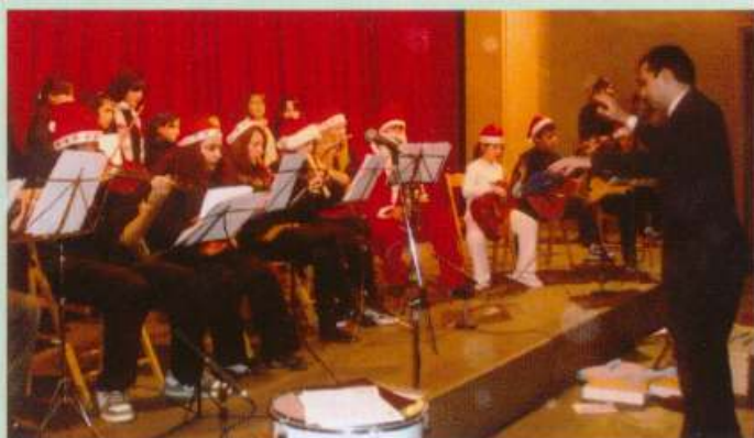
Χριστουγεννιάτικη παιδική γιορτή, 19/12/07