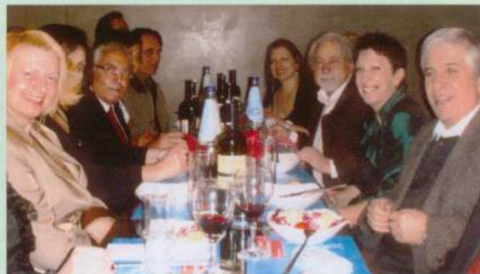
Μουσική βραδυά, Μαρινέλλα 20/2/08