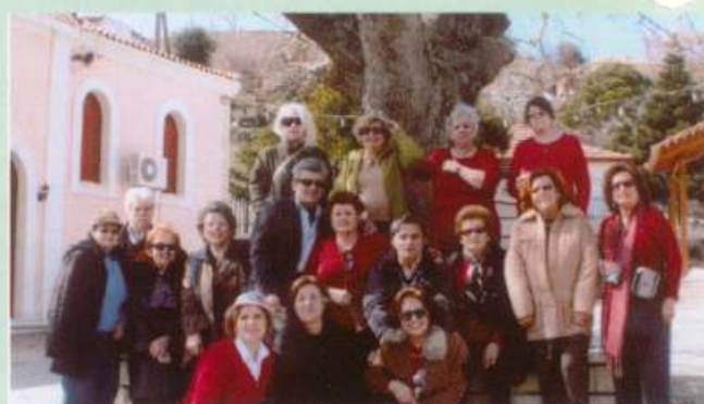
Γρηγόρη Αιγειαλείας 2/3/08