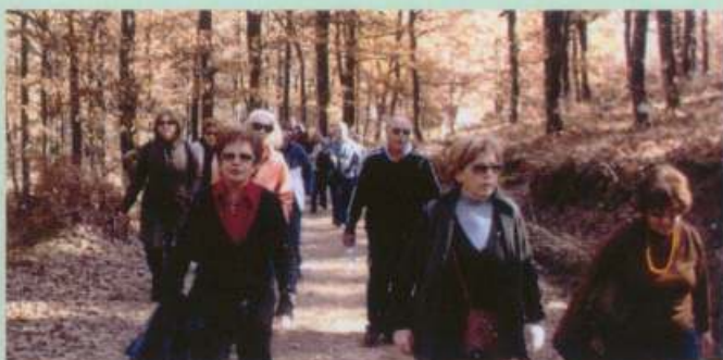
Δάσος Φολή 25/11/07