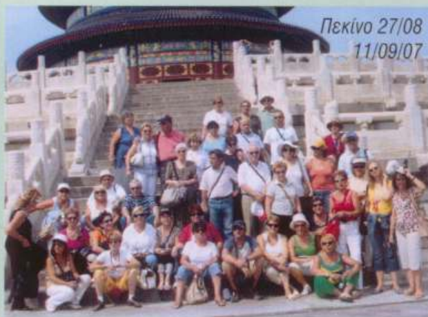
Πεκίνο 27/08 11/09/07