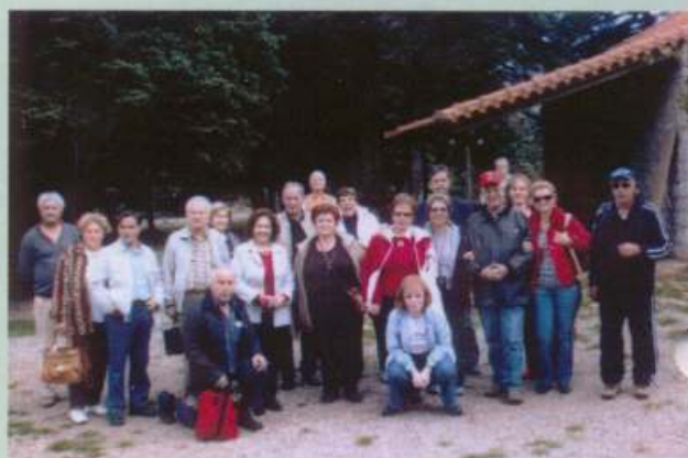
Κυριάκι Όσιος Λουκάς 21/10/07