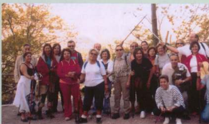
Δημητσάνα Λαγκάδια 6-7/10/07