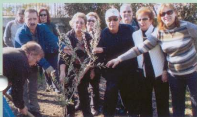
Συμβολικό φύτεμα ελιάς στο καμένο Γούμερο Ηλείας 25/11/07