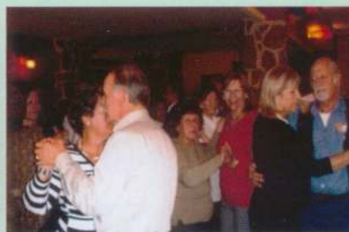
Συνεστίαση στο Βα-Βαί 18/11/07