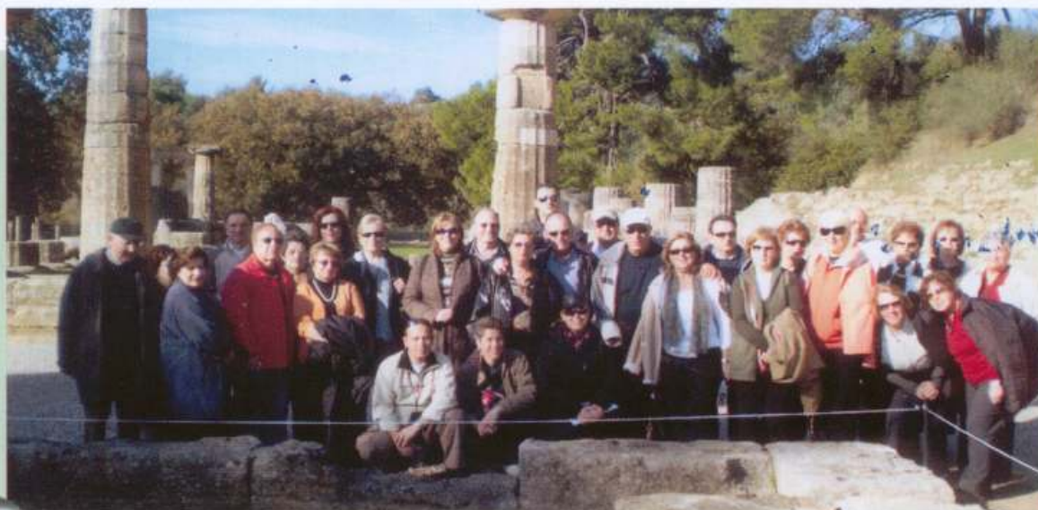
Αρχαία Ολυμπία 25/11/07