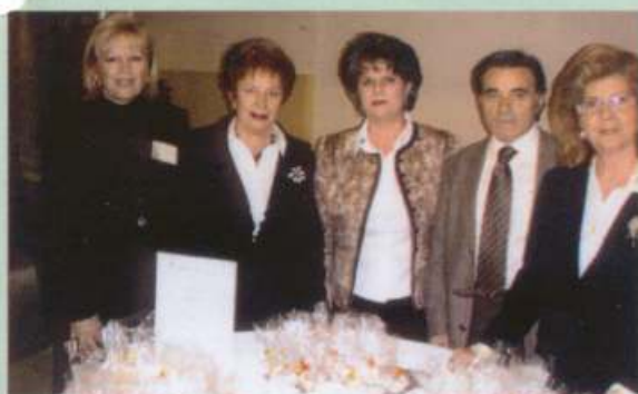
Συμπόσιο ΚΕΜΙΠΟ 23/11/07. Προσφορά γλυκών από τον Φυσιολατρικό Όμιλο Ν.Ιωνίας