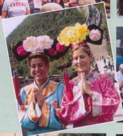
ΚΙΝΑ Σινικό Τείχος 27/08 – 11/09/07