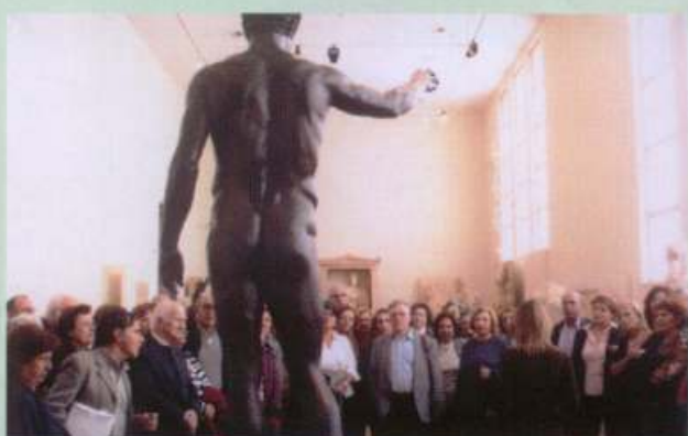
Αρχαιολογικό Μουσείο 18/11/07