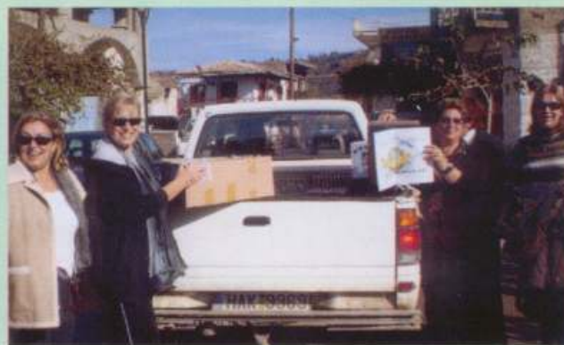
Προσφορά βιβλίων από τα μέλη του συλλόγου μας στο καμένο Γούμερο Ηλείας 25/11/07