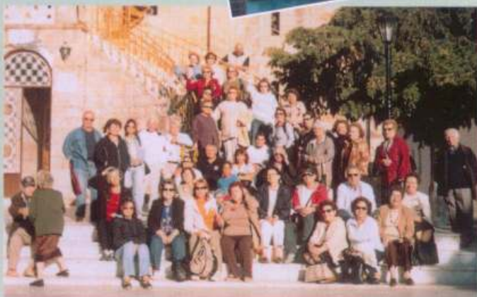
Αλεποχώρι Ψάθα – Βίλλια 23/09/07