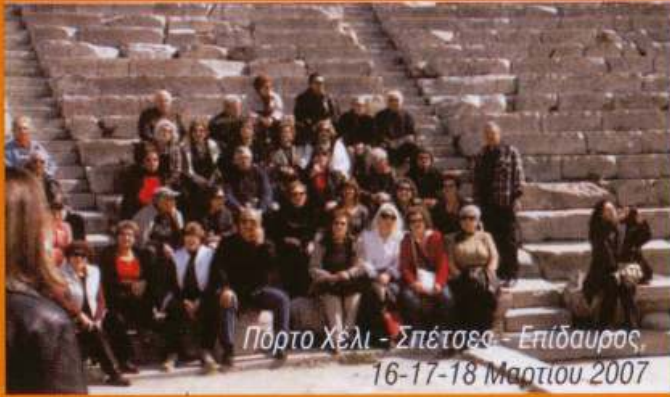
Πορτο Χέλι - Σπέτσες - Επίδαυρος, 16-17-18 Μαρτίου 2007