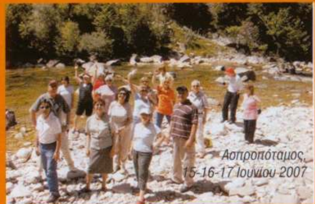
Ασπροπύργος, 15-16-17 Ιουνίου 2007