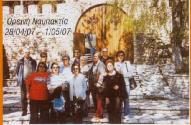
Ορεινή Ναυπακτία 28/04/07 - 1/05/07