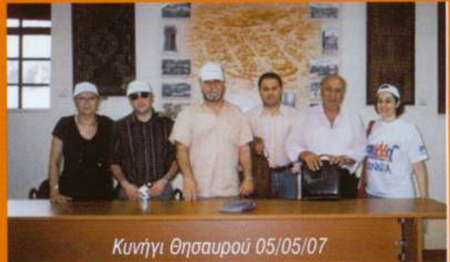
Κυνήγι Θησαυρού 05/05/07