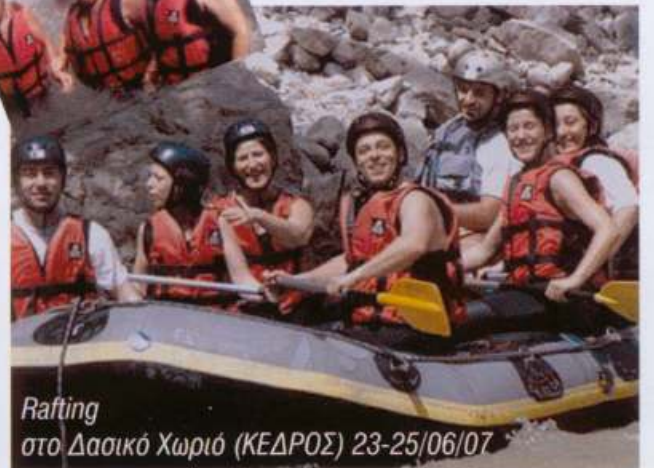
Rafting στο Δασικό Χωριό (ΚΕΔΡΟΣ) 23-25/06/07