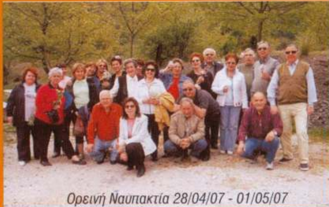
Ορεινή Ναυπακτία 28/04/07 - 01/05/07