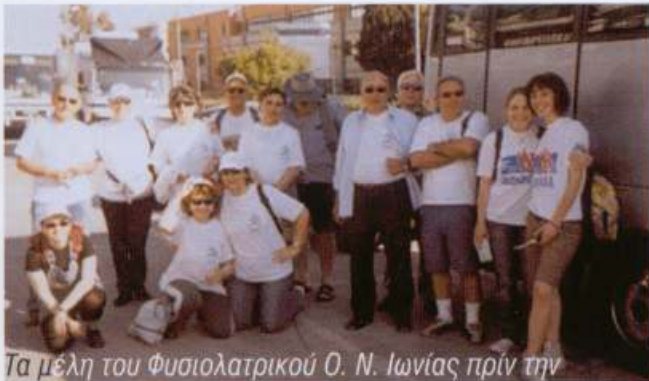
Τα μέλη του Φυσιολατρικού Ο. Ν. Ιωνίας πριν την αναχώρηση από τη Ν. Ιωνία για καθαρισμό της Παραλίας Σχοινιά μαζί με άλλους φορείς με πρωτοβουλία της οργάνωσης Μεσόγειος SOS