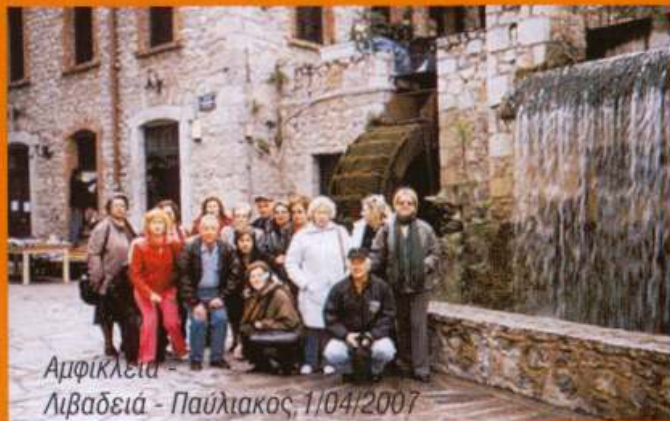
Αμφίκλεια - Λιβαδειά - Παύλιακος, 1/04/2007