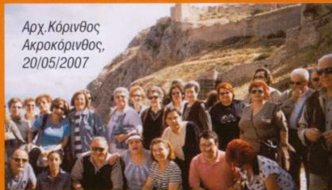
Αρχ. Κόρινθος Ακροκόρινθος, 20/05/2007