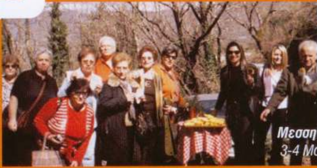
Μεσσηνιακή Μάνη, 3-4 Μαρτίου 2007