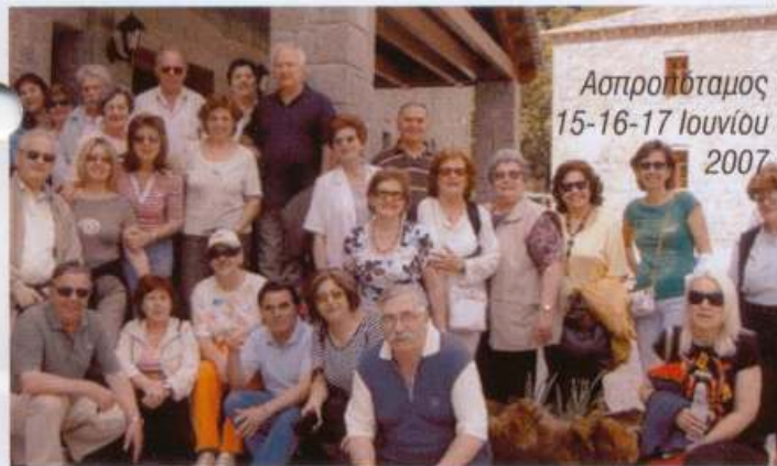
Ασπροπύλαμος 15-16-17 Ιουνίου 2007