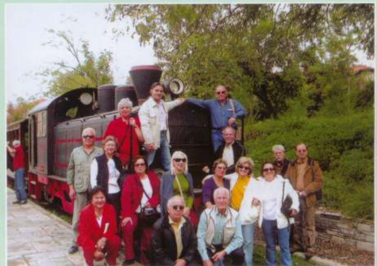
Ν. Πήλιο-Τρίκερι 27-29/10/2006