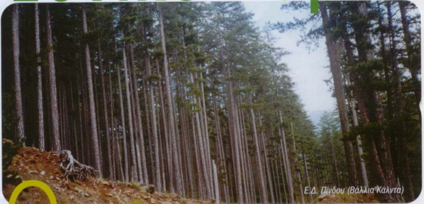
Ε.Δ. Πίνδου (Βάλια Κάλντα)

Ο όρος «Εθνικό Πάρκο» είναι μετάφραση του διεθνούς όρου "National Park". Ο όρος αυτός καθιερώθηκε στις ΗΠΑ, όπου ιδρύθηκε το πρώτο Εθνικό Πάρκο στον κόσμο, το 1864, στην περιοχή Yosemite της Καλιφόρνιας, για τη διάσωση του δάσους με τις γιγάντιες σεκόιες.