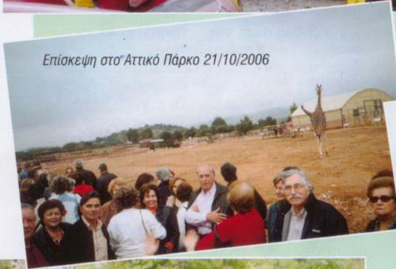
Επίσκεψη στο Αττικό Πάρκο 21/10/2006