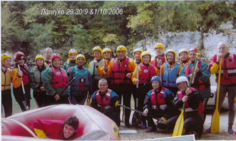
Πάπιγκο 29.30/9 & 1/10/2006