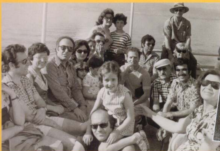
Λουτράκι, Λίμνη Ηραίου. 1972