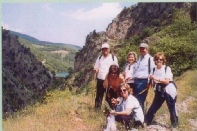
Λίμνη Πλαστήρα, 21-22-23/5/2005