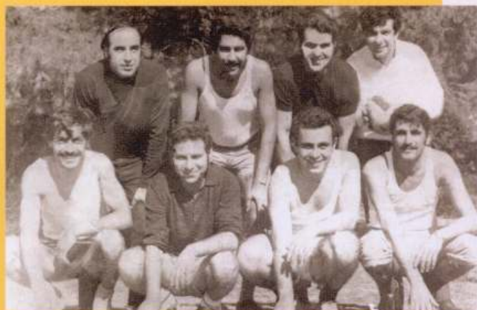
Ομάδα ποδοσφαίρου, 1966