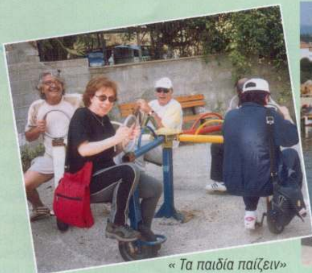
« Τα παιδιά παίζουν » Αγιάκαμπος, 4-5-6/6/2005