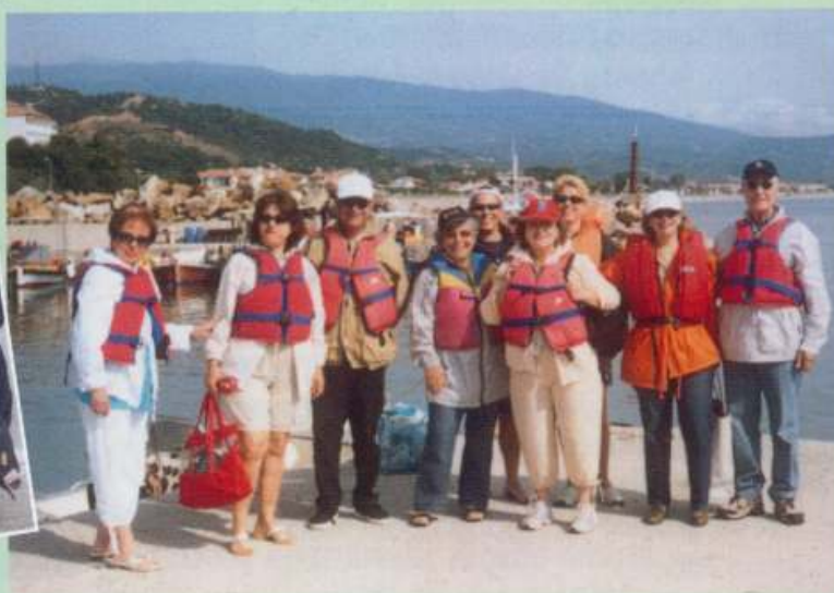
Δυτικά του Κισσάβου, Αγιάκαμπος 4-5-6/6/2005