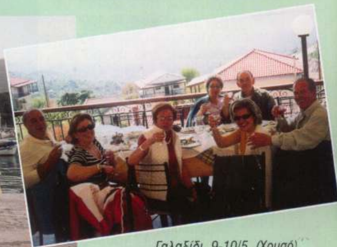
Γαλαξίδι, 9-10/5, (Χρυσό)