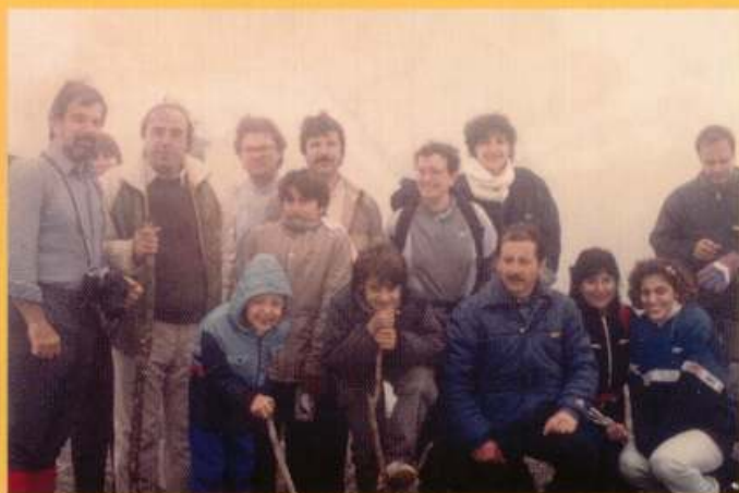
Προφήτης Ηλίας: Κορυφή του όρους Ζήρια, 1988