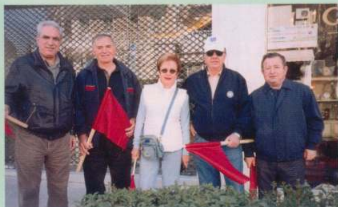
ΜΠΛΟΚΟ ΚΑΛΟΓΡΕΖΑΣ: Αγώνας δρόμου, 20/3/2005