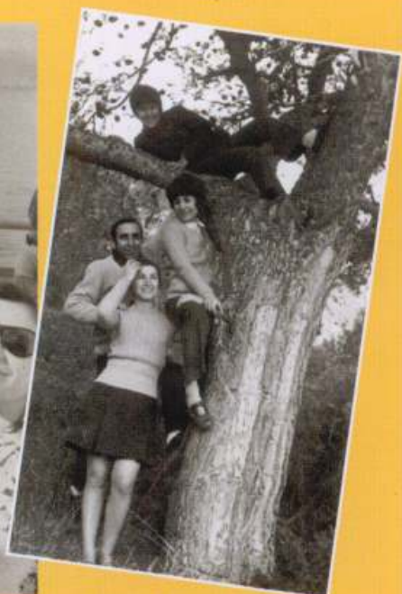
1969: Μονή Δαμάστας