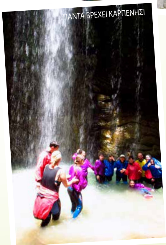
ΠΑΝΤΑ ΒΡΕΧΕΙ ΚΑΡΠΕΝΗΣΙ